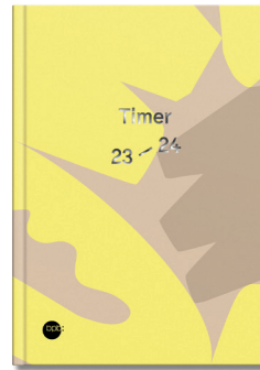
Hardcover „Scherenschnitt (Gelb)“ Bestell-Nr. 2549