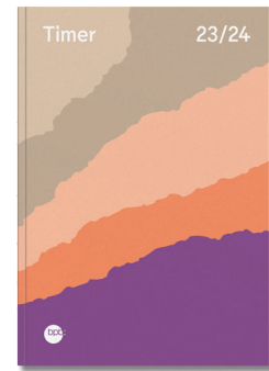
Softcover „Reißkanten“ Bestell-Nr. 2550 B